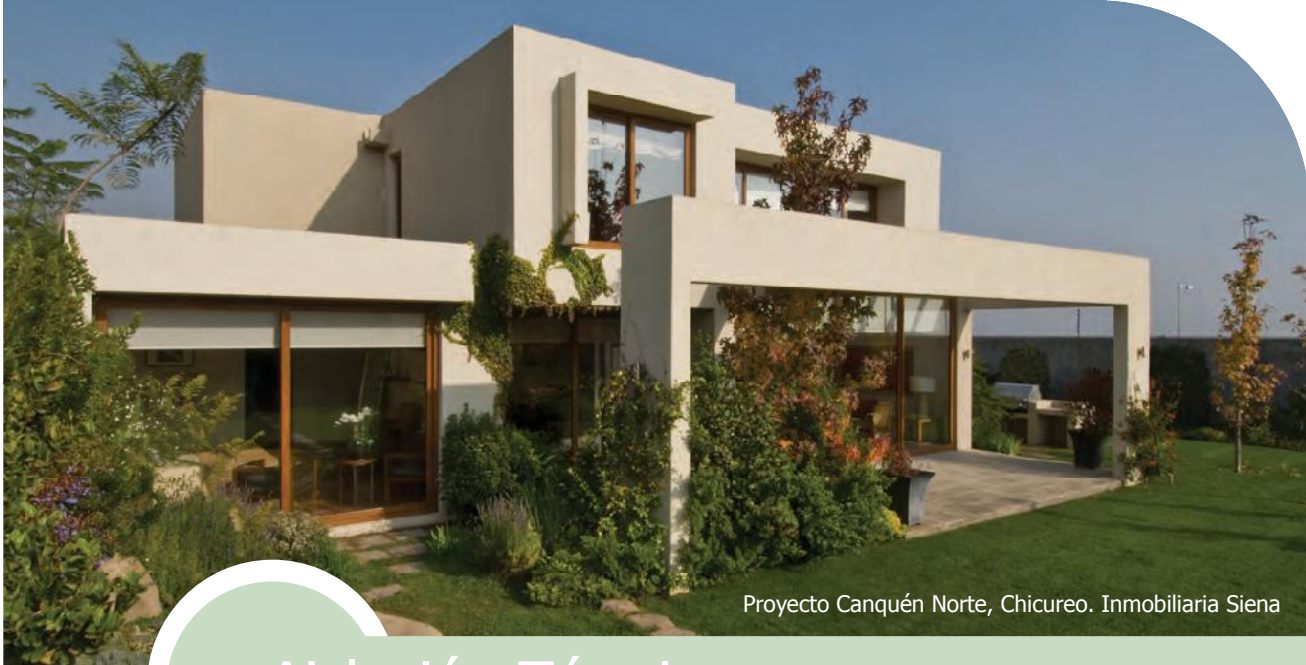
Proyecto Canquén Norte, Chicureo. Inmobiliaria Siena